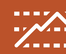
gráfico de altimetria elevation graphic